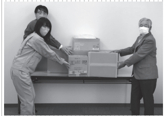
苫東石油備蓄(株)様・北海道石油共同備蓄(株)様より