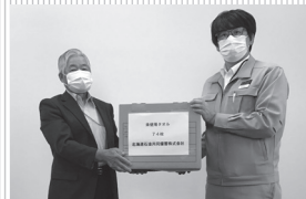
北海道石油共同備蓄 (株) 様より

北海道石油共同備蓄 (株) 北海道事業所 様 (苫小牧市) 苫東石油備蓄 (株) 苫小牧事業所 様 (苫小牧市)