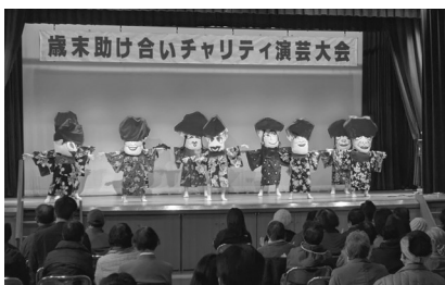
趣向を凝らした多彩なステージ