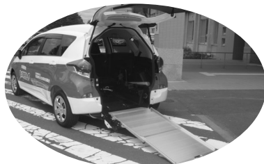
車椅子スロープ付きの車両