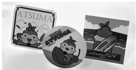
新登場の募金シール（3種類）

ご当地ピンバッジは500円以上の募金につき1個、オリジナルシールは100円以上の募金につき1枚差し上げています。募金いただく方のお気持ちに応じて、選びながらご協力いただくことができ、募金シールにもたくさんのご協力をいただいております。なお、ご当地限定のピンバッジやシールはイベントの際にご案内させていただいているほか、共同募金委員会事務局のある社会福祉協議会事務所で取り扱っています。 お問い合わせ 厚真町共同募金委員会（社協内）電話0145-26-7501