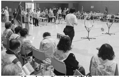
ゼッケンをつけて応援

7月6日（土）にむかわ町四季の館で開催された、第50回胆振管内身体障害者スポーツ大会に、同協会の厚真支部から23人が参加しました。