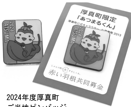
2024年度厚真町 ご当地ピンバッジ