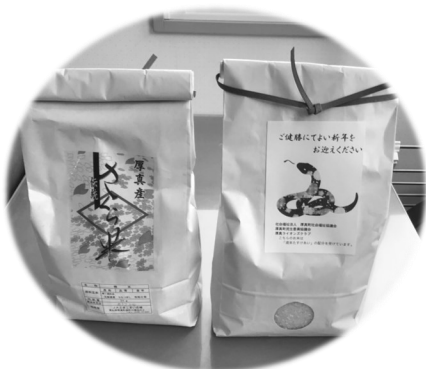
地域の思いやりがコメられています

12月1日から地域歳末たすけあい運動として多くの町民の皆様や関係団体などから義援金のご協力をいただきました。