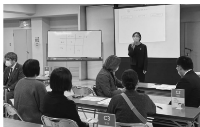
いざという時の行動を体験