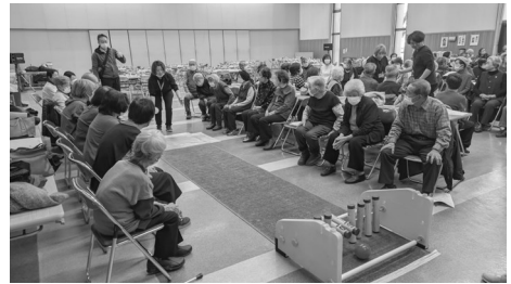
地区を超えて交流を深めました

「しばらくぶり！」「元気だった？」声を掛け合う参加者の皆さん。令和6年11月26日に、ふれあいサロン合同交流会を総合福祉センターで開催しました。